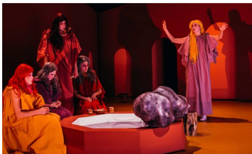
Mare av Lisa Lie. Scenograf og kostymedesignar: Maja Nilsen. Lysdesignar: Kerstin Weimers

Nyheter ( http://www.scenekunst.no/sak/category/nyheter/ ) ( http://www.scenekunst.no/sak/category/nyheter/ )